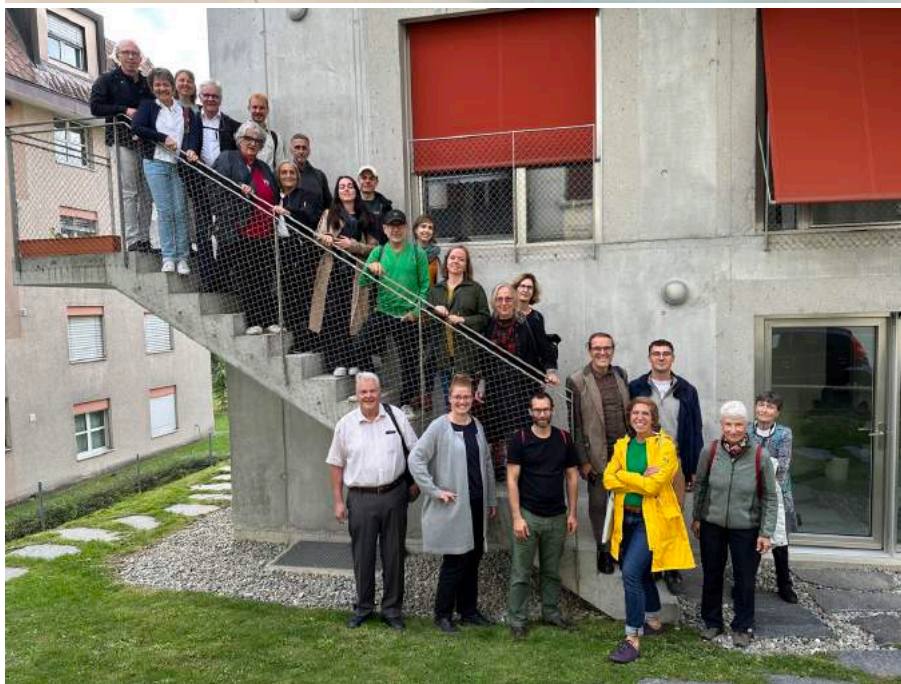
Tagesausflug mit 22 Reisenden