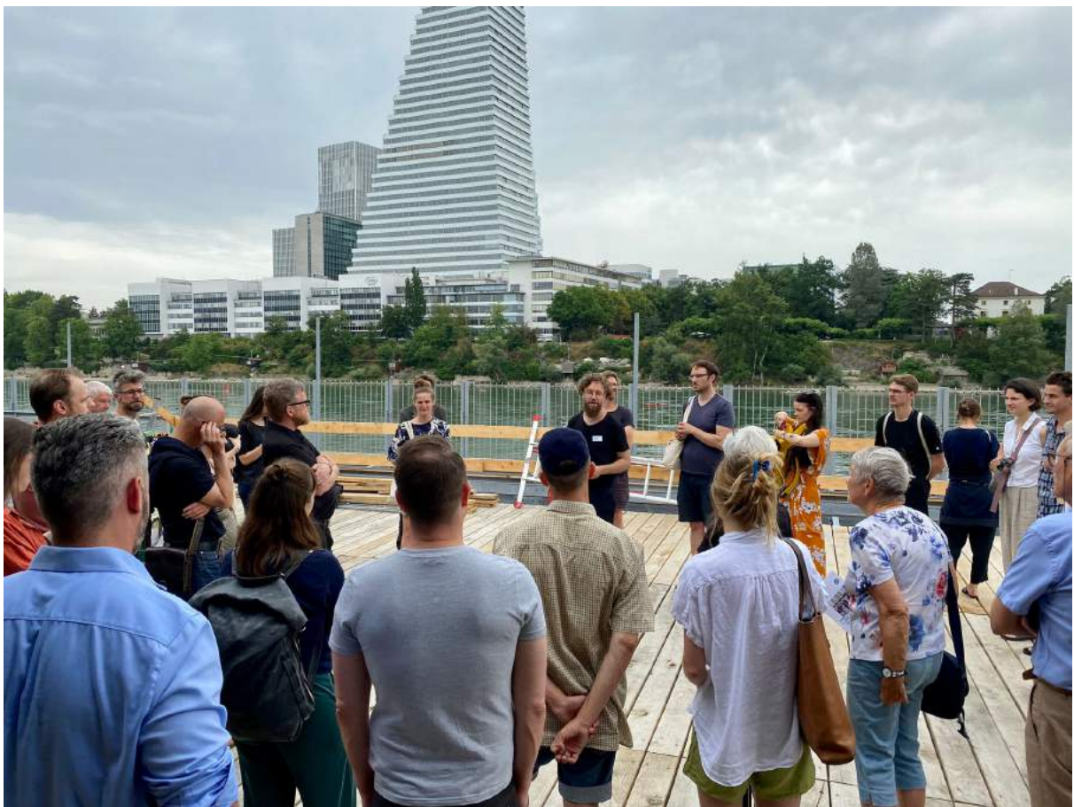
Präsenzveranstaltung mit mehr als 110 Gästen